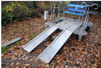
Rampen für Rollstuhl