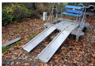
Fahrgeschäft / Draisine