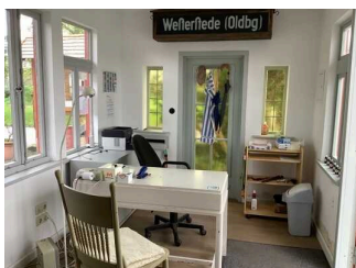
Schalter / Kassentisch