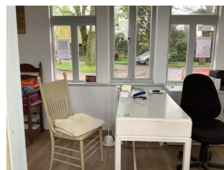
Schalter / Kassentisch