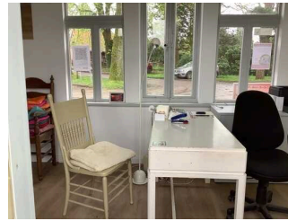
Schalter / Kassentisch