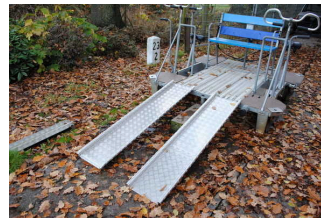
Fahrgeschäft / Draisine