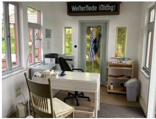
Schalter / Kassentisch