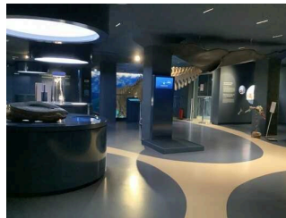
Ausstellungsräume 1. OG