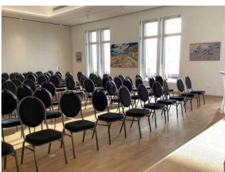
Veranstaltungsraum und Panorama- Terrasse 4.OG