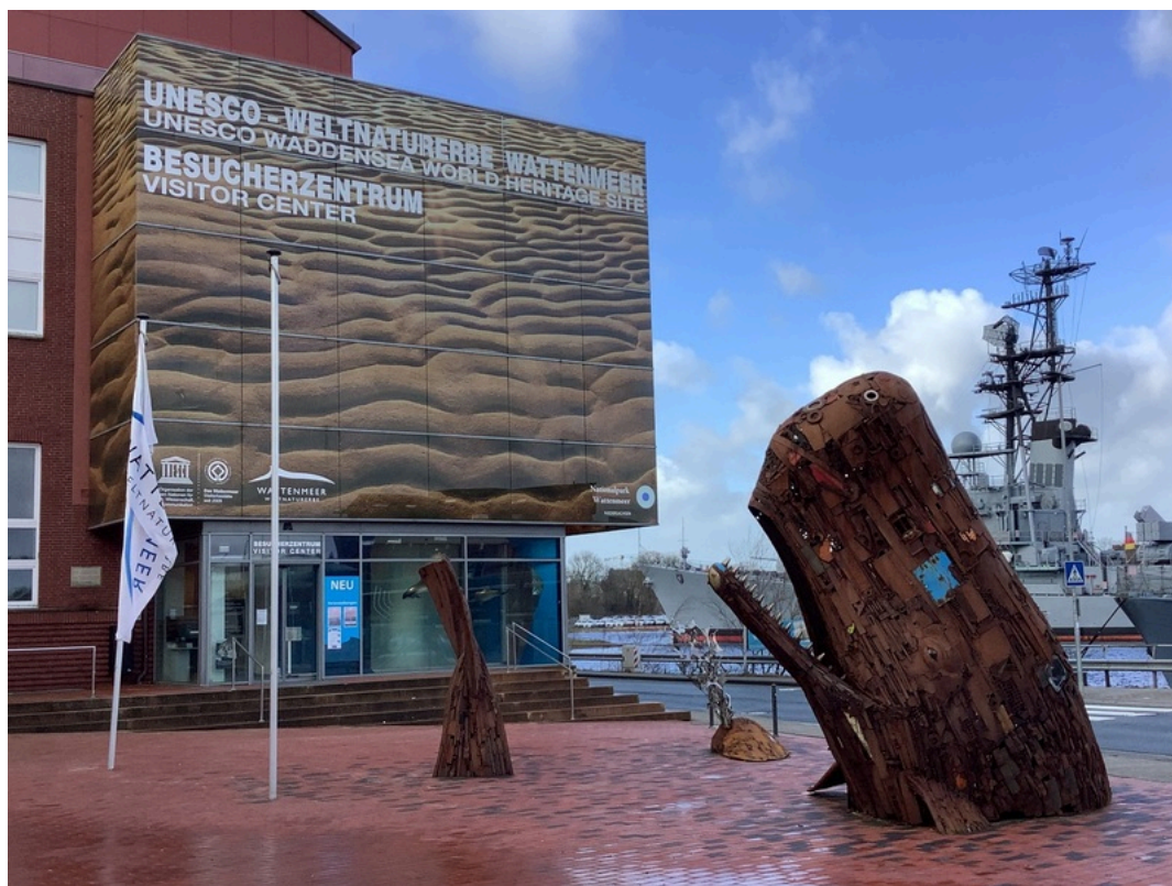
UNESCO-Weltnaturerbe Wattenmeer – Besucherzentrum Wilhelmshaven