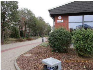
Weg Parkplatz Richtung Eingang