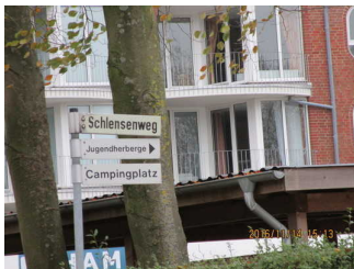
Wegweiser an Privatstraße