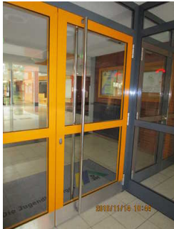
Haupteingang Innentür (Weg zur Innentür)