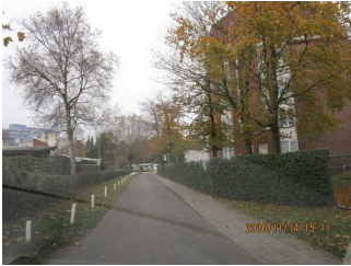
Zuwegung über Privatstraße

Es gibt ein unterbrechungsfreies Wegeleitsystem.