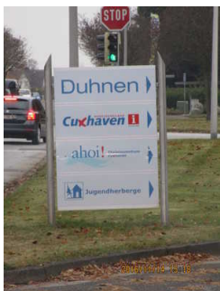
Wegweiser am Ortseingang von Duhnen