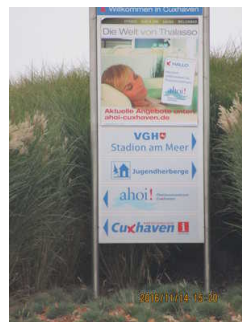
Wegweiser am Duhner Kreisel

Es sind Informationen vorhanden, die der Orientierung dienen und aus Wörtern bestehen. Informationen zur Orientierung sind in leichter Sprache verfügbar.