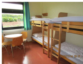
Sitzecke und Betten