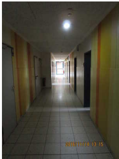
Flur Schlaftrakt Haus A