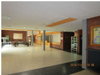
Haupteingang zur Rezeption