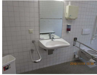
Waschbecken Sanitärraum für Menschen mit Behinderung