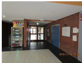
Hauptflur Richtung Speisesaal