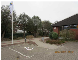
Parkplatz und Weg zum Eingang