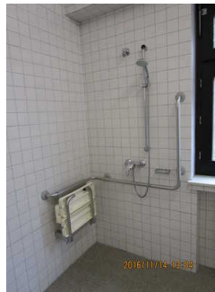
Dusche Sanitärraum für Menschen mit Behinderung