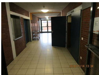
Flur hinter Tür Richtung Speisesaal