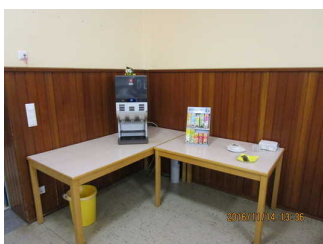
Heißgetränkeautomat im Speisesaal