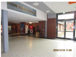
von der Rezeption zu den Automaten