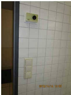
Lichtschalter Sanitärraum für Menschen mit Behinderung

Es ist kein Alarmauslöser (Schnur, Knopf) vorhanden.