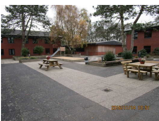
Innenhof (Gebäude in der Mitte hinten mit Tischtennishalle und Disco)