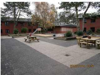
Innenhof (Gebäude in der Mitte hinten mit Tischtennishalle und Disco)