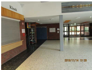
Rezeption Richtung Speisesaal