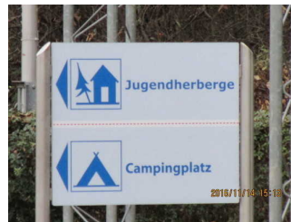
Wegweiser gegenüber Privatstraße