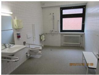
Raumansicht Sanitärraum für Menschen mit Behinderung