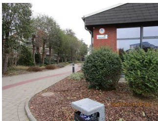
Weg zum Parkplatz