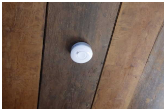
Decken- Rauchmelder in den Speisräumen