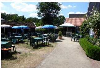
Sitzplätze im ersten Aussenbereich