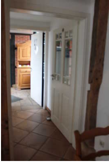
Durchgang zum Sanitärraum