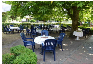
Sitzplätze im zweiten Aussenbereich

Es handelt sich um zwei Sitzflächen im Aussenbereich.