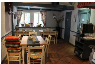
Speiseraum mit Tresen