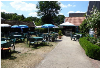
Sitzplätze im ersten Aussenbereich