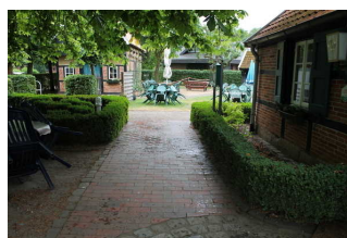
Weg vor dem Eingangsbereich