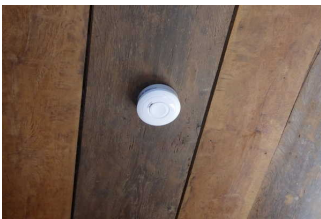
Decken- Rauchmelder in den Speisräumen