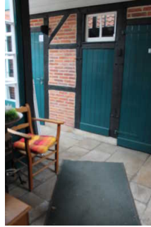
Bereich vor dem Sanitärraum