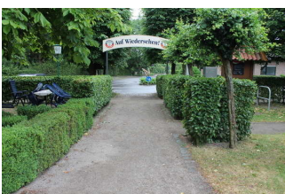
Weg zum Parkplatz