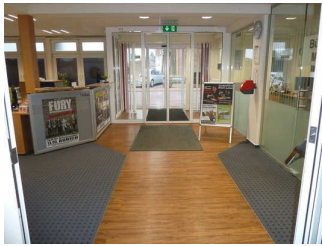
Tresen im Schalterraum