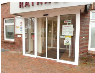
Windfang im Eingangsbereich