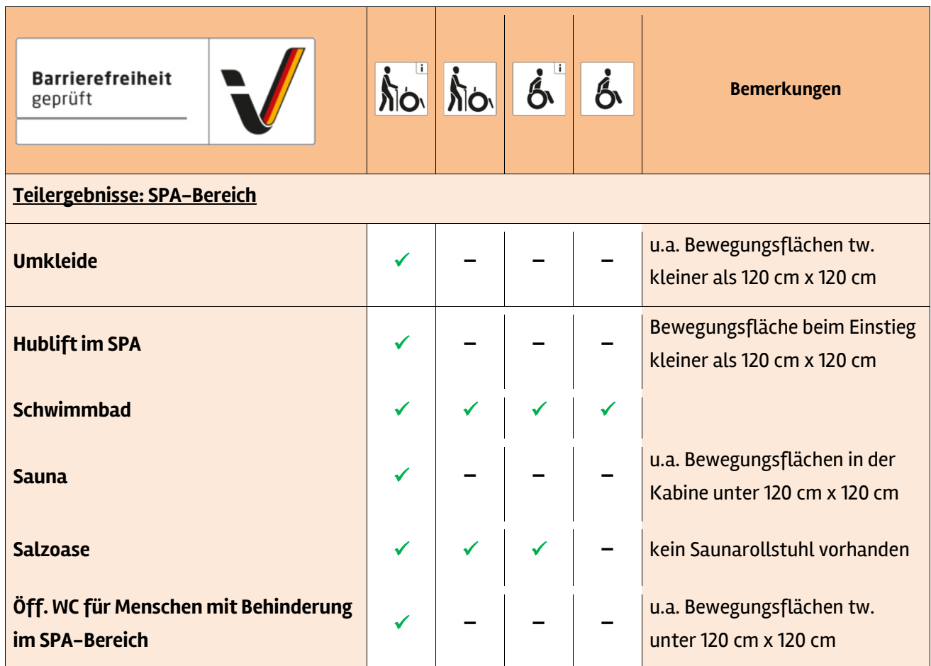
Tabelle 1: Überblick über das Prüfergebnis