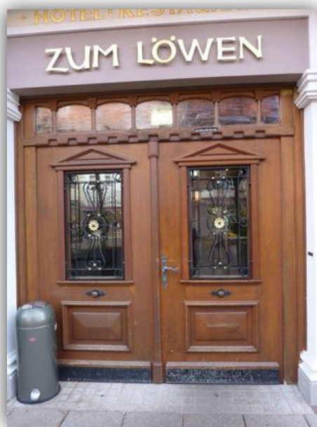
Hotel Zum Löwen