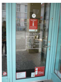
Tür Tourist- Information