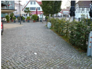
Weg vom Parkplatz f. Menschen m. Behinderung zur Tourist-Information