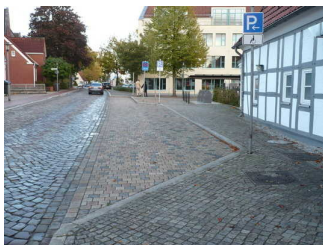
Parkplatz für Menschen mit Behinderung

Es ist ein allgemeiner Parkplatz vorhanden.