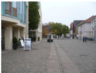
Weg außen vor dem Eingangsbereich