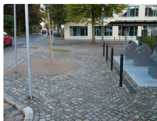
Weg vom Parkplatz f. Menschen m. Behinderung zur Tourist-Information