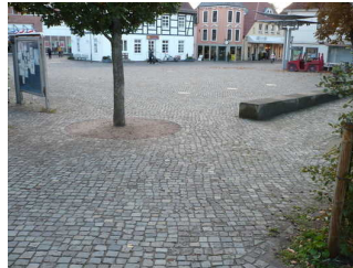
Weg vom Parkplatz f. Menschen m. Behinderung zur Tourist-Information