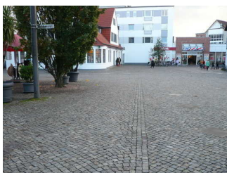
Weg vom Parkplatz f. Menschen m. Behinderung zur Tourist-Information