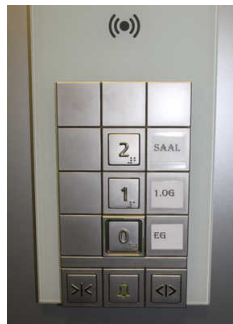
Aufzug ins 1. und 2. OG

Die Bedienelemente bzw. die Beschilderung sind weder bildhaft noch (im Falle eines entsprechenden Leitsystems) farblich gekennzeichnet.