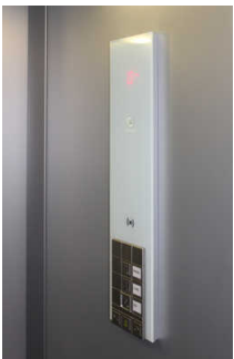
Aufzug ins 1. und 2. OG