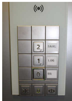
Aufzug ins 1. und 2. OG

Die Bedienelemente bzw. die Beschilderung sind weder bildhaft noch (im Falle eines entsprechenden Leitsystems) farblich gekennzeichnet.