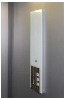
Aufzug ins 1. und 2. OG