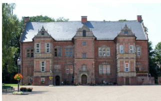
Schloss Erbhof Thedinghausen mit Tourist-Information