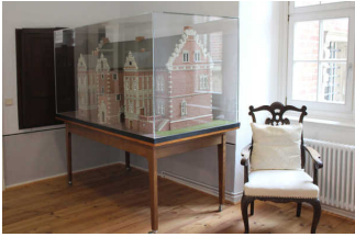
Ausstellungsraum im 1. OG

Informationen zu den Exponaten werden schriftlich vermittelt.