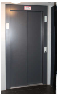
Aufzug ins 1. und 2. OG