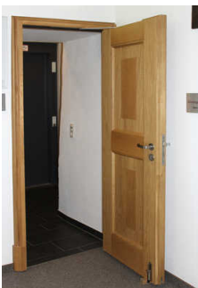
Tür zur Ausstellung im 1. OG