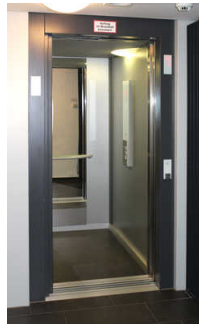
Aufzug ins 1. und 2. OG