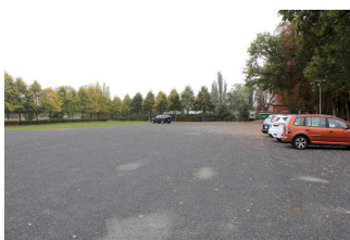
Parkplatz am Schloss Erbhof Thedinghausen

Es ist ein allgemeiner Parkplatz vorhanden.