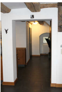
Flur zum WC für Menschen mit Behinderung