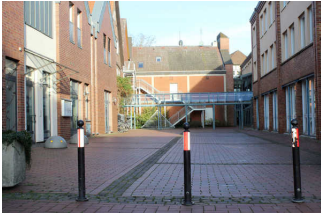
Weg vom Parkplatz zum Nebeneingang (Hinterhof)