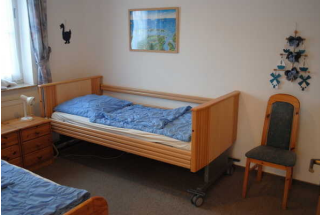
Schlafräum mit Pflegebett