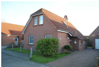
Ferien für Alle - Friesenhaus