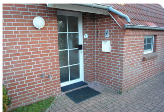
Weg außen auf dem Parkplatz und zum Eingang