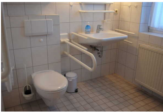
Bad im EG für Menschen mit Behinderung