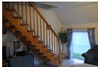
Treppe zum Obergeschoss

Im Erdgeschoss befinden sich ein Schlafzimmer mit einem Pflegebett, ein Badezimmer sowie eine Wohnküche mit Zugang zur Terrasse.