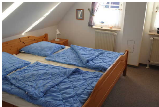
Doppelzimmer im Obergeschoss