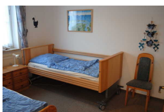
Schlafräum mit Pflegebett