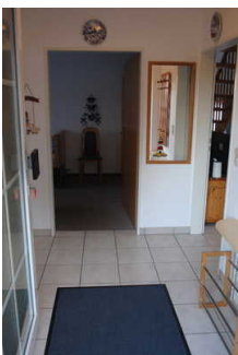
Flur im Eingangsbereich