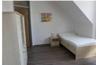
Schlafzimmer Nr. 130 (Zweibettzimmer, Foto 2)