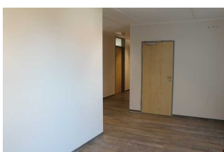
Flur auf der 1. Etage (vom Treppenhaus bzw. Aufzug zu den Zimmern)