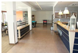
Rezeption vom Jugendgästehaus (linke Seite = Teil der Lobby)

Der Schalter/Tresen/die Kasse ist von der Eingangstür aus direkt sichtbar.