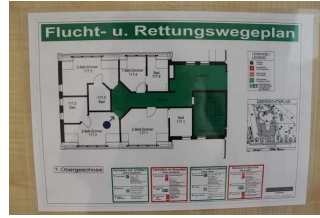
Flucht- und Rettungswegeplan (im Zimmer)

Es sind Informationen vorhanden, die der Orientierung dienen und aus Wörtern bestehen.