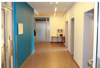
Flur im Tagungsbereich