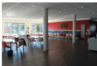
Mensa im Jugendgästehaus (Blick in den Raum 1)