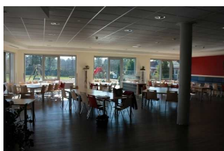
Mensa im Jugendgästehaus (Blick in den Raum 2)