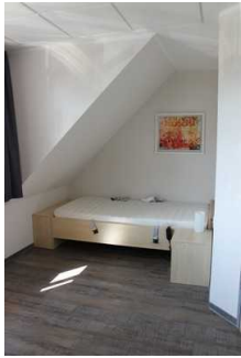
Schlafzimmer Nr. 130 (Zweibettzimmer, Foto 1)