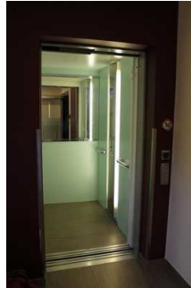
Aufzug (Ansicht im 1. OG)

Die Bedienelemente bzw. die Beschilderung sind weder bildhaft noch (im Falle eines entsprechenden Leitsystems) farblich gekennzeichnet.