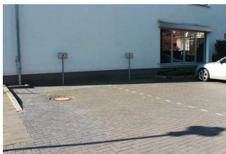
Parkplätze für Menschen mit Behinderung (hinten)