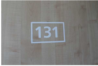
Schild / Aufkleber auf Zimmertür