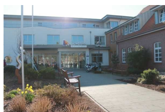
Jugendgästehaus Johannesburg - Außenansicht