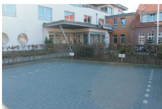
Parkplätze für Menschen mit Behinderung (vorne)