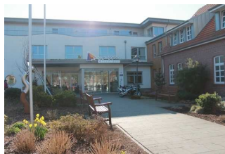
Zugang zum Jugendgästehaus von der Kirchstraße

Name und Logo des Betriebes/der Einrichtung sind von außen klar erkennbar.