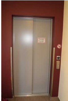
Aufzug (Ansicht im Erdgeschoss)