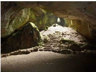
Endpunkt des Führungsweges, die "blaue Grotte". Ab hier umkehren.

Weder ist das Ziel des Weges in Sichtweite, noch gibt es ein unterbrechungsfreies Wegeleitsystem oder Wegezeichen in sichtbarem Abstand.