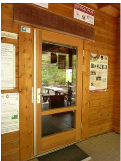
Eingangstür Bereich Kasse, Sanitär, Gastronomie

Name bzw. Logo des Betriebes/der Einrichtung sind von außen klar erkennbar.