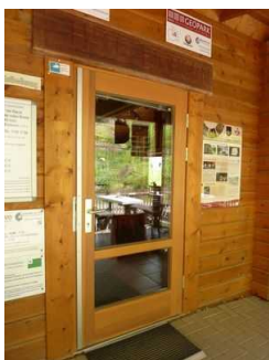
Eingangstür Bereich Kasse, Sanitär, Gastronomie

Der Eingangsbereich ist visuell kontrastreich zur Umgebung abgesetzt.