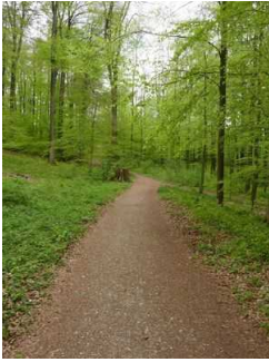
Weg vom Parkplatz zum Eingang