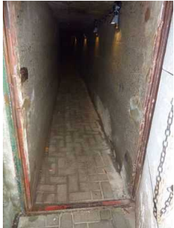
Zuwegung zur Höhle (unter Tage)