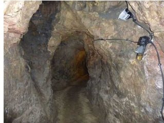
Zuwegung zur Höhle