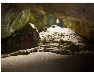
Endpunkt des Führungsweges, die "blaue Grotte". Ab hier umkehren.