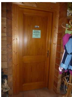
Tür zum Vorflur öffentliches WC