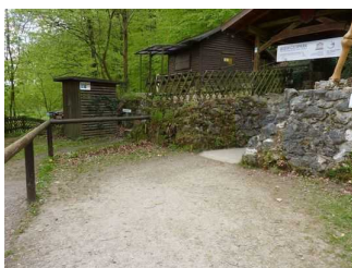
Weg von Kasse zu Höhleneingang