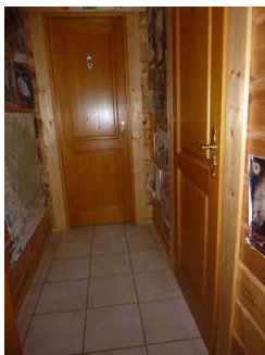
Vorflur öffentliches WC