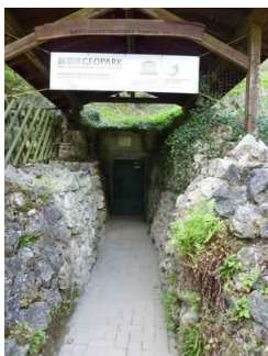
Weg zum Höhleneingang