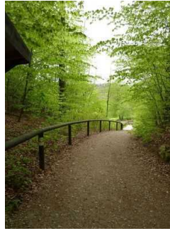
Weg vom Parkplatz zum Eingang