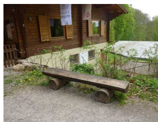
Sitzgelegenheit auf Weg zu Höhleneingang