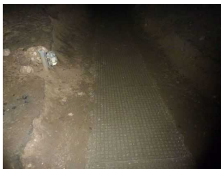
Befestigter Weg innerhalb der Höhle