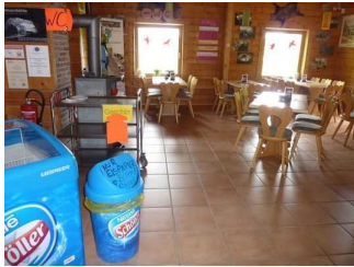
Weg von Eingangstür in Richtung öffentliches WC