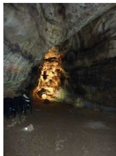
Weg durch die Höhle