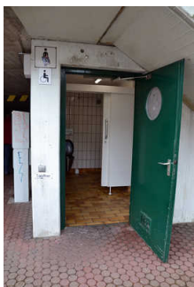
Hinweis auf Alternativ-WC