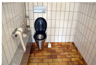
Hinweis auf Alternativ-WC