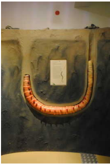
Bild von Exponat Wattwurm im Bereich Leben im Watt