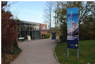
Seehundstation Nationalpark-Haus Norddeich