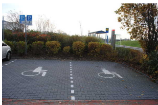
Parkplatz für Menschen mit Behinderung