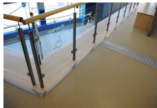
Plätze für Menschen mit Behinderung vor dem Seehundbecken