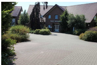
Parkfläche und Hotel in Sichtweite

Es ist ein allgemeiner Parkplatz vorhanden.