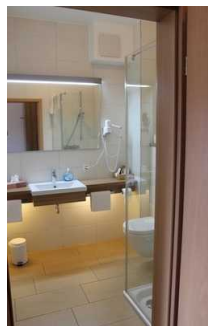
Blick in den Sanitärraum