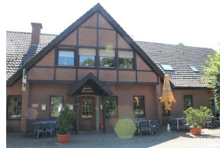
Ansicht Gaststätte Heilemann