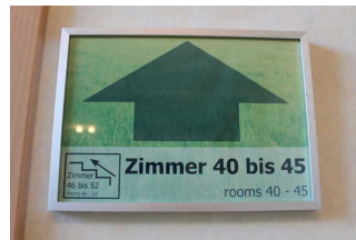
Hinweis Zimmer- Wegweiser