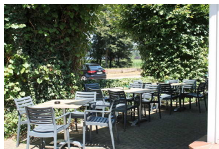
Weitere Sitzgelegenheiten im Außenbereich der Gaststätte

Es handelt sich um zwei Sitzflächen im Außenbereich. Mehrere Tische mit Lehnstühlen und Bänken stehen den Gästen zur Verfügung. Der Boden ist gepflastert und bietet eine gute Begeh- und Befahrbarkeit. Die Bereiche weisen keine Neigungen, Stufen oder Schwellen auf. Es ist eine Unterfahrbarkeit der Tische gegeben.