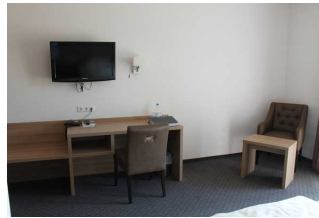
Sitzgelegenheit im Doppelzimmer Komfort