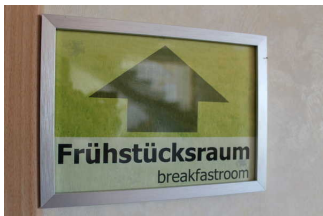
Hinweise sind zweisprachig.