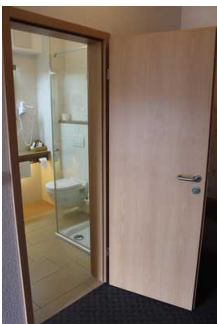
Zimmertür zum Sanitärraum

Es ist kein Alarmauslöser (Schnur, Knopf) vorhanden.