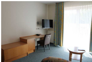
Sitzgelegenheit und Fernseher im Wohnraum