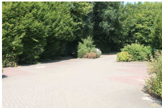
Beispiel Hotel- Parkplatz