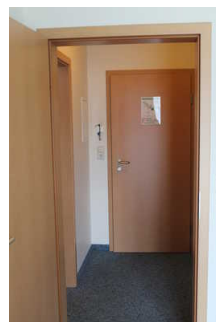
Eingang zum Appartment und Zugang zum Schlafraum