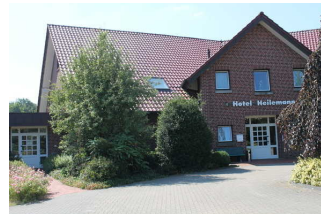
Haupteingang Hotel und zusätzliche Fläche zum Ein-/ Aussteigen und Entladen