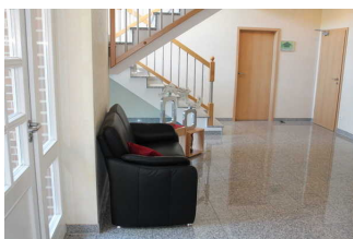
Flurbereich mit weiterer Durchgangstür