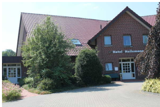
Ansicht Hotel Heilemann