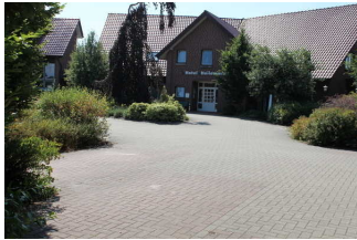
Weg vom Parkplatz zum Hoteleingang