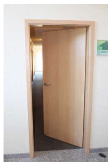
Verbindungsstür vom Treppenhaus zum Nebenflur