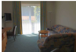
Wohnraum mit Sitzecke Apartment