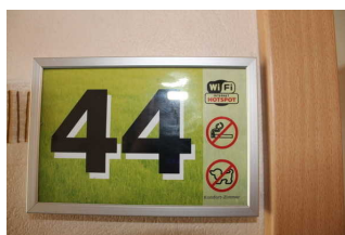
Hinweisschilder sind teilweise mit Piktogrammen versehen.