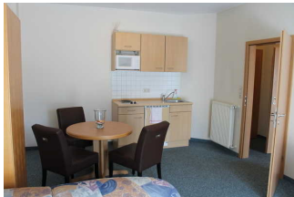
Wohnraum mit Küchenzeile und kleinem Essbereich

Anmerkungen für den Gast: Tischhöhe 75 cm. Unterfahrbarkeit in einer Höhe von 70 cm mit einer Tiefe von 35 cm.