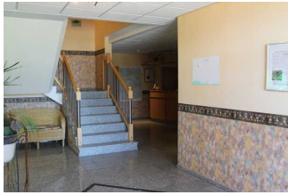
Flur innen ab Eingangstür bis Rezeption