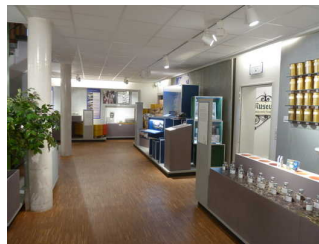
Ausstellungsraum "Anbau und Ernte, Mischung und Handel"