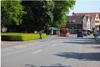
Haltestelle / Bussteig