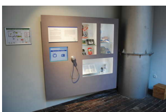
Bild von Exponat auf der Führung