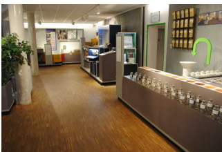
Weitläufige Ausstellungsräume im Erdgeschoss - Tee in Ostfriesland