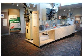
Ausstellung Mischung und Handel , Anbau und Ernte