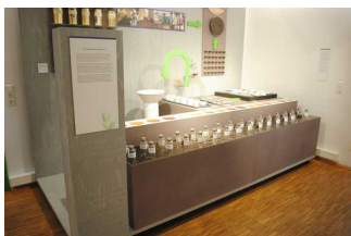
Exponat - Die Mischung macht's