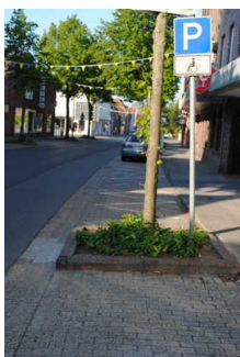
Öffentlicher Parkplatz für Menschen mit Behinderung in der Westerstrasse