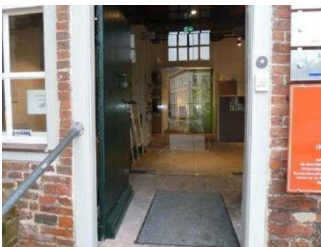
Windfang zwischen der Haupteingangstür und dem Kassenraum