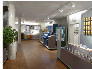
Ausstellungsraum "Anbau und Ernte, Mischung und Handel"