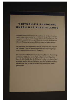
Exponat - Virtueller Rundgang