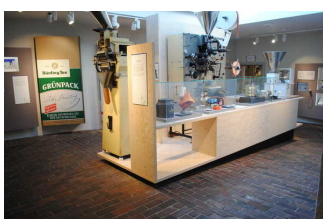
Ausstellung Mischung und Handel , Anbau und Ernte