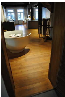
Weitläufige Ausstellungsräume im Erdgeschoss - Tee in Ostfriesland