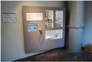
Bild von Exponat auf der Führung