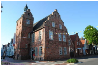
Ostfriesisches Teemuseum Norden