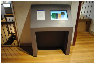
Exponat - Virtueller Rundgang