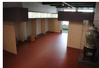
Weitläufige Ausstellungsräume im Erdgeschoss - Tee in Ostfriesland