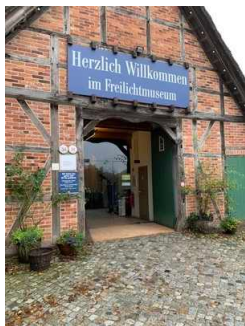
Freilichtmuseum am Kiekeberg