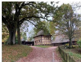
Freilichtmuseum am Kiekeberg