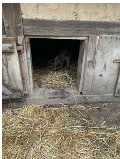
Freilichtmuseum am Kiekeberg