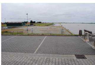
Parkplatz für Menschen mit Behinderung