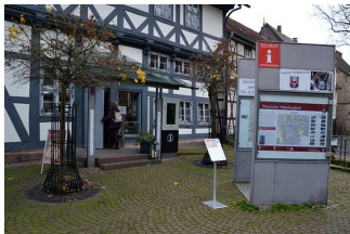
Touristik- Information Uslar