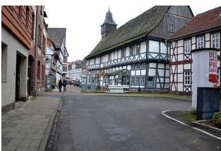
Weg vom Parkplatz zum Eingang