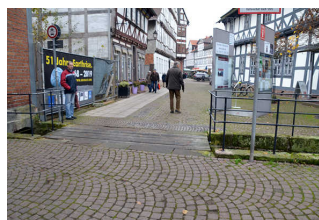
Weg vom Parkplatz zum Eingang