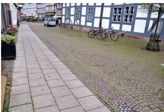
Weg vor dem Eingang