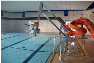
Alarm/Hilfsmittel - Erstgespräch