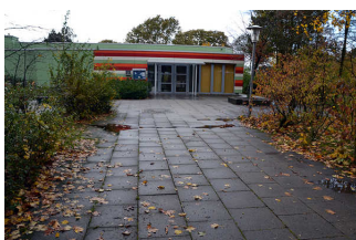
Weg zum Eingang