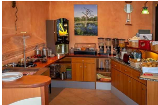
Restaurant Auf dem Simpel