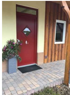
Sanitärraum Herren (Kopie)