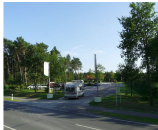
Campingplatz Auf dem Simpel