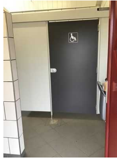
Sanitärraum Herren (Kopie)