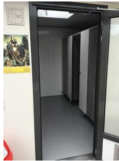
Sanitärraum Herren (Kopie)