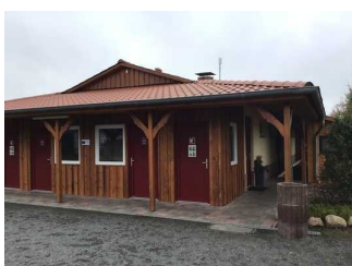
Weg von der Rezeption zum Waschhaus 2