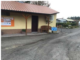
Weg vom Eingangsbereich zur Rezeption / Restaurant / SB-Shop / Waschaus 1