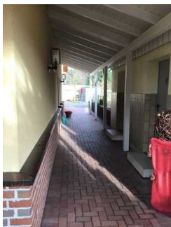
Weg vom Eingangsbereich zur Rezeption / Restaurant / SB-Shop / Waschaus 1