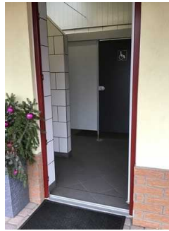
Waschhaus 2 Damen