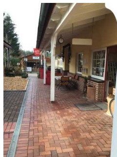
Weg vom Eingangsbereich zur Rezeption / Restaurant / SB-Shop / Waschaus 1