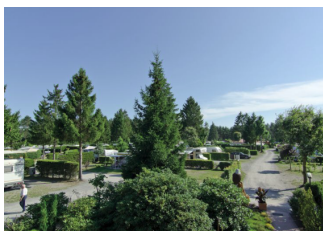
Weg von der Rezeption zum Waschhaus 2