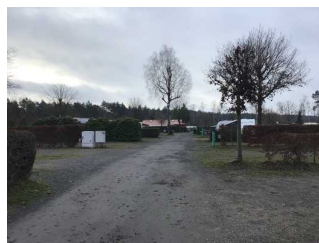
Weg von der Rezeption zum Waschhaus 2