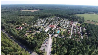
Campingplatz Auf dem Simpel