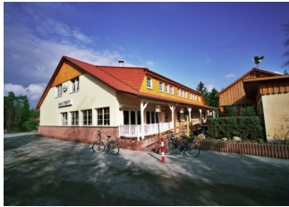
Restaurant Auf dem Simpel