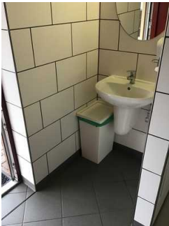
Sanitärraum Herren (Kopie)