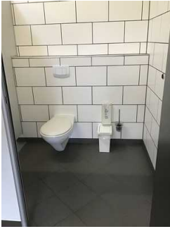
Sanitärraum Herren (Kopie)