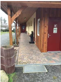
Sanitärraum Herren (Kopie)