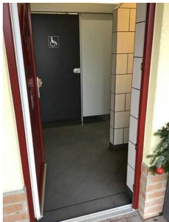
Waschhaus 2 Herren