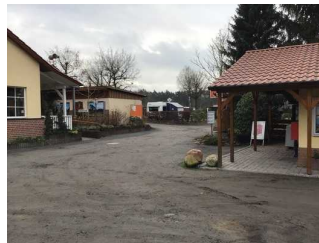
Weg vom Eingangsbereich zur Rezeption / Restaurant / SB-Shop / Waschaus 1