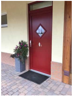
Waschhaus 2 Damen