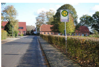
Bushaltestelle Schloss Evenburg