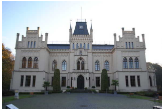
Eingang zum Schloss