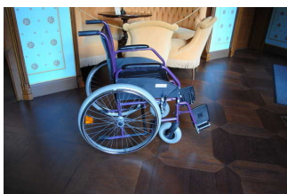
Alarm/Hilfsmittel - Erstgespräch