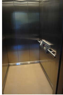
Aufzug ins OG