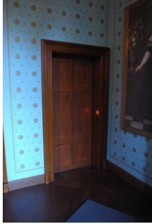
Aufzug ins OG