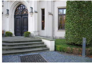
Eingang zum Schloss