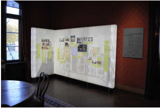
Ausstellungsräume / weitläufige Räume im EG