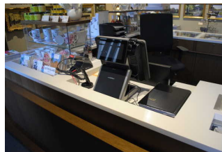
Information / Kasse für Schloss und Shop