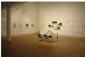
Ausstellungsraum im 1.OG