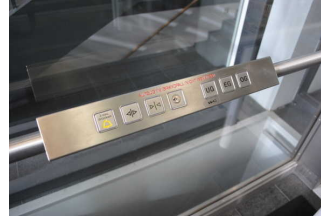
Aufzug UG/ EG/1.OG