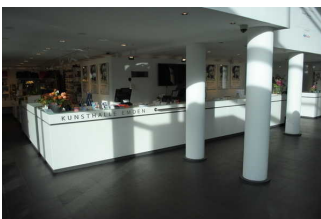
Information / Kasse Shop und Museum