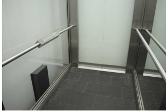
Aufzug UG/ EG/1.OG