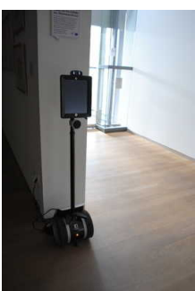
Alarm/Hilfsmittel - Erstgespräch