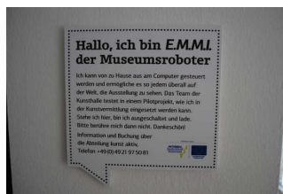
Alarm/Hilfsmittel - Erstgespräch