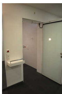
Alarm/Hilfsmittel - Erstgespräch