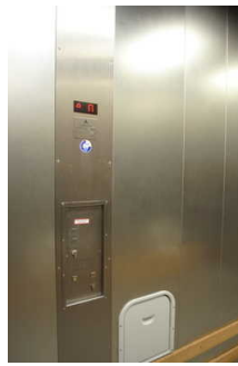
Lastenaufzug EG-tief / 1.OG