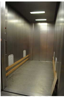
Lastenaufzug EG-tief / 1.OG