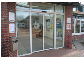
Eingang Haus des Gastes "Kogge"