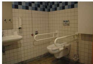
Öffentliches WC in der Kogge