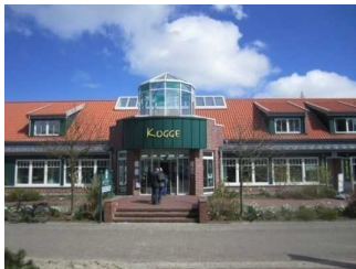
Bild von Haus des Gastes der Nordseebad Spiekeroog GmbH