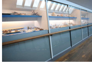
Muschelausstellung im OG der Kogge