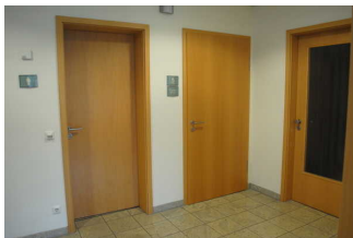
Öffentliches WC in der Kogge