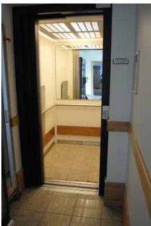
Aufzug vom Foyer/ Tourist-Info zur Muschelausstellung im OG und zur Kegelbahn im UG