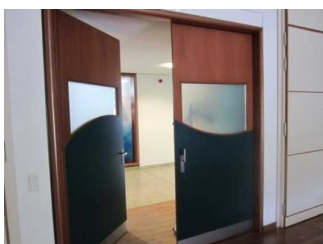
Tür zum Veranstaltungssaal 1