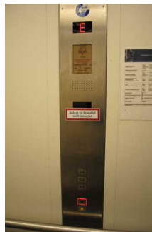
Aufzug vom Foyer/ Tourist-Info zur Muschelausstellung im OG und zur Kegelbahn im UG