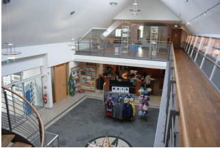
Muschelausstellung im OG der Kogge