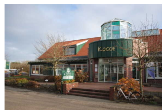
Eingang Haus des Gastes "Kogge"