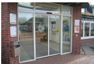
Eingang Haus des Gastes "Kogge"