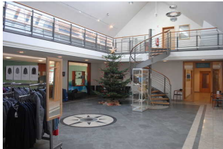
Tourist-Information/ Foyer Haus des Gastes "Kogge"