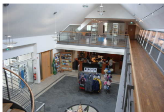
Muschelausstellung im OG der Kogge