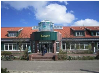
Außenbereich Haus des Gastes