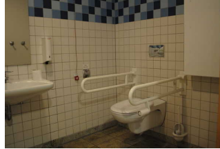
Öffentliches WC in der Kogge