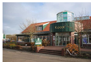
Eingang Haus des Gastes "Kogge"