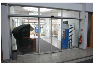
Windfang im Eingang in die "Kogge"