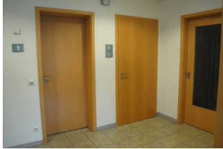
Öffentliches WC in der Kogge