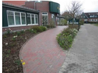
Weg für Menschen mit Behinderung zum Eingang im Außenbereich