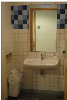
Öffentliches WC in der Kogge