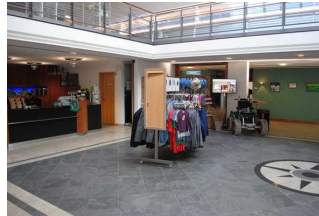
Tourist-Information/ Foyer Haus des Gastes "Kogge"