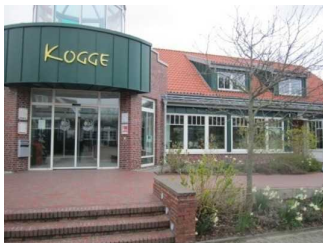
Treppe zum Eingang