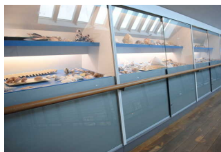
Muschelausstellung im OG der Kogge