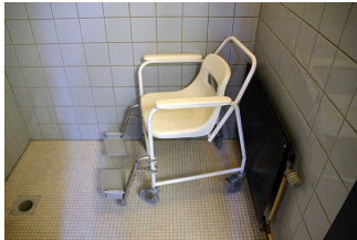
Alarm/Hilfsmittel - Erstgespräch