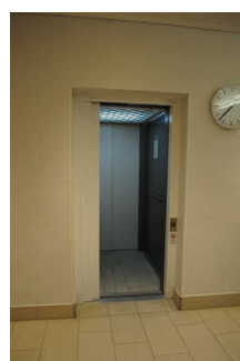
Aufzug zwischen Foyer Eingang und DünenSpa im OG