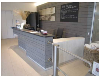
Empfang InselBad & DünenSpa, Schalter/Kasse InselBad