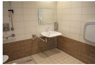
Dusche und WC für Menschen mit Behinderung zum Bad und den Spa-Bereich