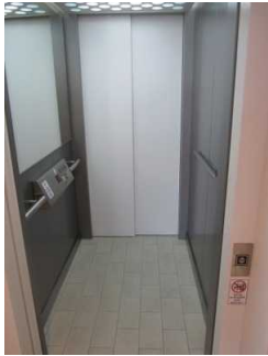
Aufzug vom Foyer des InselBades ins DünenSpa im OG