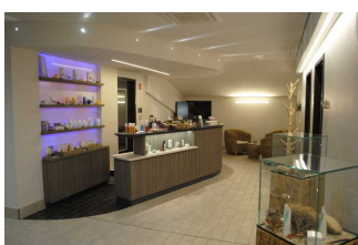
Foyer DünenSpa im OG