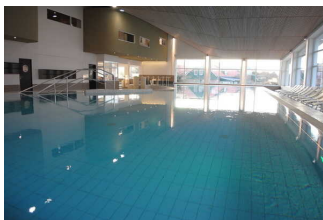
InselBad & DünenSpa der Nordseebad Spiekeroog GmbH