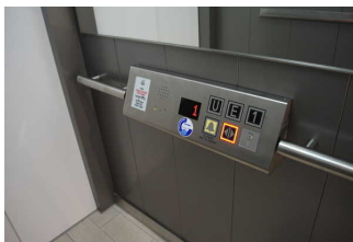
Aufzug zwischen Foyer Eingang und DünenSpa im OG