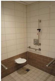
Dusche und WC für Menschen mit Behinderung zum Bad und den Spa-Bereich