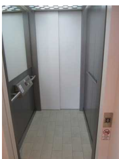
Aufzug vom Foyer des InselBades ins DünenSpa im OG