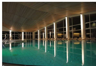
InselBad & DünenSpa der Nordseebad Spiekeroog GmbH