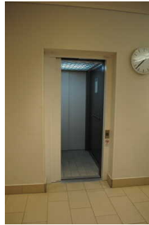
Aufzug zwischen Foyer Eingang und DünenSpa im OG