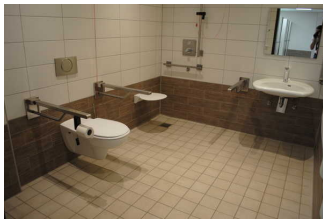
Dusche und WC für Menschen mit Behinderung zum Bad und den Spa-Bereich